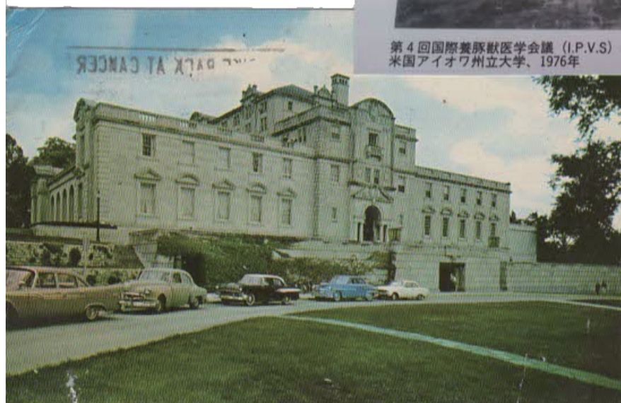
この写真の右上の室が宿舎でした

MEMORIAL UNION BUILDING IOWA STATE UNIVERSITY, AMES, IOWA Student Center, home of University Book Store, Cafeteria, Snack bar and office of student organization.