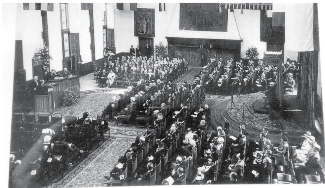
第4回国際家畜繁殖学会の開会式（1961年6月）オランダ国ハーグ、Knight's Hallにおいて「豚における人工授精の研究と実際」（日本から基調講演者に初めて指名される）