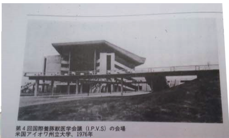
第4回国際養豚獣医会議（I.P.V.S）の会場 米国アイオワ州立大学、1976年